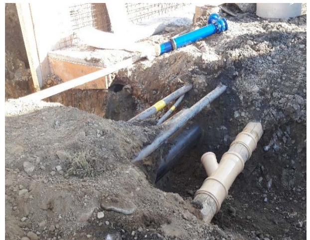
Figure 2: Photo du chantier