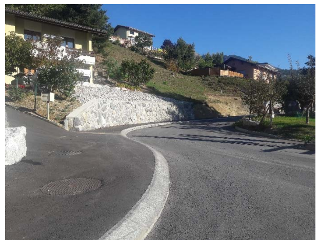
Figure 3: Situation après travaux